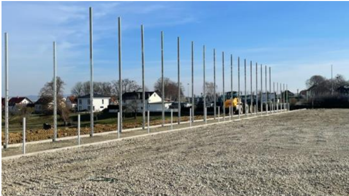
Text: Steven Kranitz

Bessere Trainingsbedingungen, sowie eine deutliche Entlastung der Rasenplätze in Calden und Meimbressen werden die Folge sein.